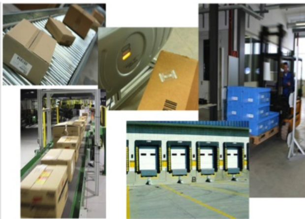
Abb. 2: RFID-Anwendungsbeispiele

Durch die konsequente Vernetzung und interdisziplinäre Zusammenarbeit zwischen Forschung und Wirtschaft im Bereich RFID, soll ein wesentlicher Beitrag zur Sicherung und zum Ausbau von Wertschöpfung und Arbeitsplätzen am Standort Bayern und Deutschland geleistet werden.